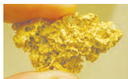
طلا به صورت تکه ها و رگه های درخشان در بین برخی سنگ ها و خاک ها یافت می شود