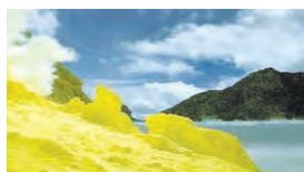
گوگرد به صورت بلور های زرد و کدر در دهانه آتشفشانهای خاموش و نیمه فعال دیده میشود

۲. مثال هایی را از موادی که مستقیماً از طبیعت بدست می آیند و روش استخراج آن ها را بنویسید . الف ( گوگرد که به صورت بلورهای زرد و کدر در دهانه آتشفشان های خاموش و نیمه فعال وجود دارد . ب ( طلا به صورت تکه ها یا رگه های فلزی درخشان در لایه لایه برخی از خاک و سنگ ها یافت می شود . ج ( الماس را می توان به صورت بلورهای زیبا و درخشان در داخل سنگ های آتشفشانی جست و جو کرد . د ( نمک خوراکی را می توان از آب دریا تهیه کرد